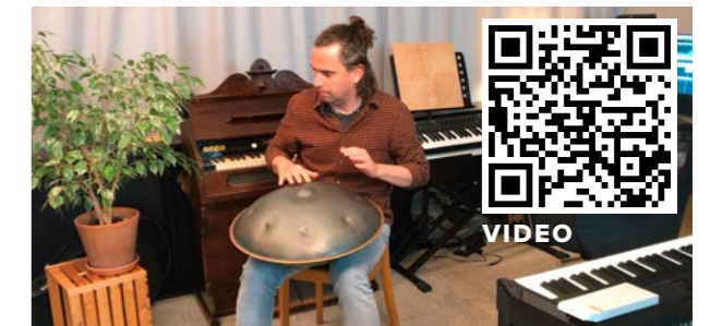
Im Werkstatt-Video kannst Du in «Songs of Peace» Reinhören.

In den kommenden Monaten werden wir weiter an diesen neuen Songs arbeiten und diese dann in Form von Ton- und Videoaufnahmen, sowie Notenblättern veröffentlichen. ■